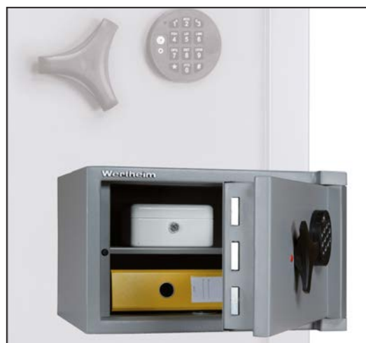
Einrichtungsbeispiele (Lieferung ohne Geldkassette und Ordner)